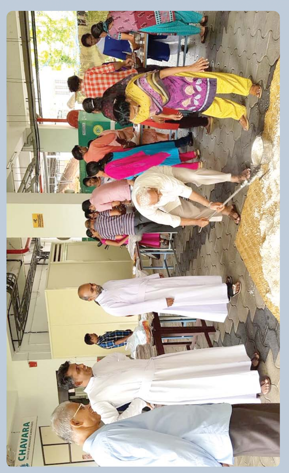
Preparation of food packets for Flood Relief Camps at St. Joseph's Monastery, Karikkamury